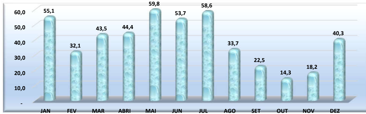
Município de Canindé do São Francisco Gráfico 02 - Pluviosidade Média Acumulada Anual - 2000 a 2021