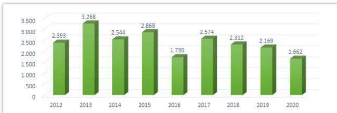
Gráfico 01 - Público assistido/atendido pelos principais programas e ações