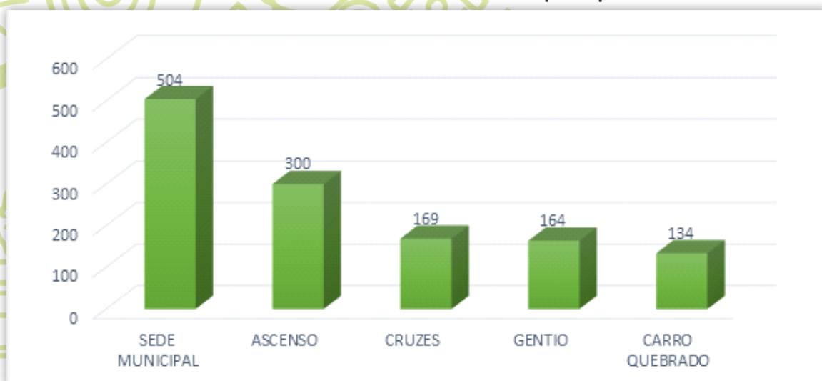
Gráfico 02 – Público cadastrado e assistido nas principais comunidades