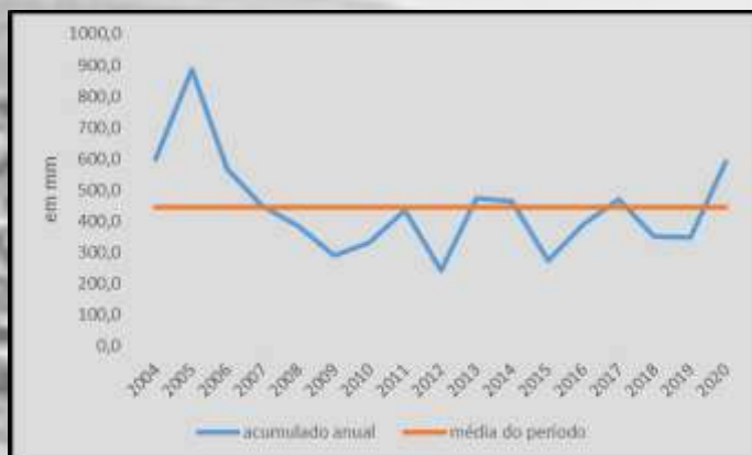
GRÁFICO 01 – PLUVIOSIDADE ANUAL E MÉDIA DO PERÍODO 2004 A 2020