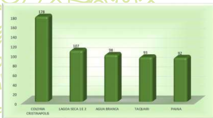
Gráfico 04 – Propriedades cadastradas e assistidas nas principais comunidades - 2012 a 2019

Além das ações de atendimento e assistência aos produtores e trabalhadores rurais, a Emdagro também desenvolve ações de políticas agrícolas em apoio a organizações rurais e entidades públicas, a exemplo de associações, grupos de produtores e produtoras rurais, grupos de jovens, conselho municipal, entre outros. Nesse sentido, estão relacionadas no quadro 07 as organizações e entidades cadastradas pela Emdagro, para as quais foram prestados diversos serviços no período de 2012 a 2019.