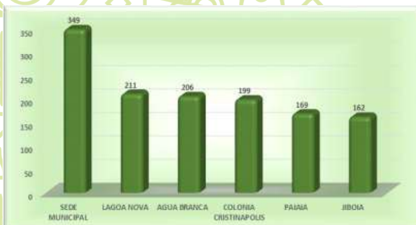
Gráfico 03 – Público cadastrado e assistido nas principais comunidades - 2012 a 2019

No mesmo período, foram cadastradas e assistidas 1.201 propriedades rurais, sem repetição, destacando-se as comunidades de Colônia Cristinópolis, Lagoa Seca 1 e 2, Água Branca, Taquari e Paiaia, ver quadro 06