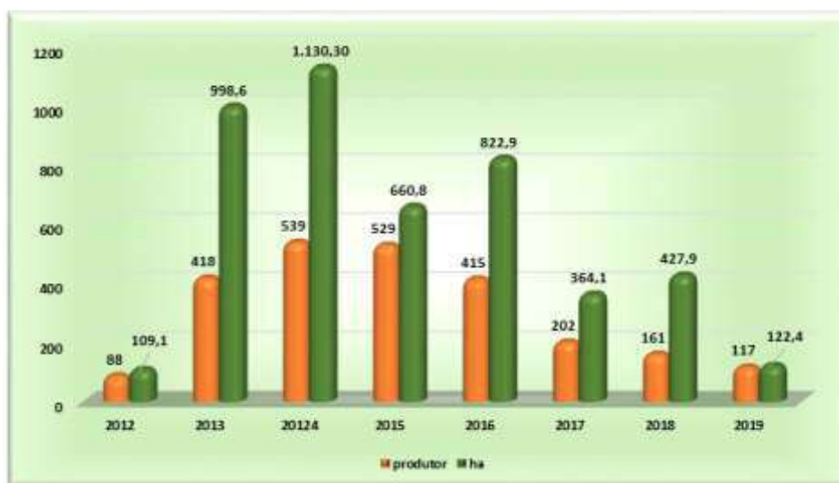
Município de Cristinápolis Gráfico 02 – Agricultores e áreas assistidas - 2012 a 2019