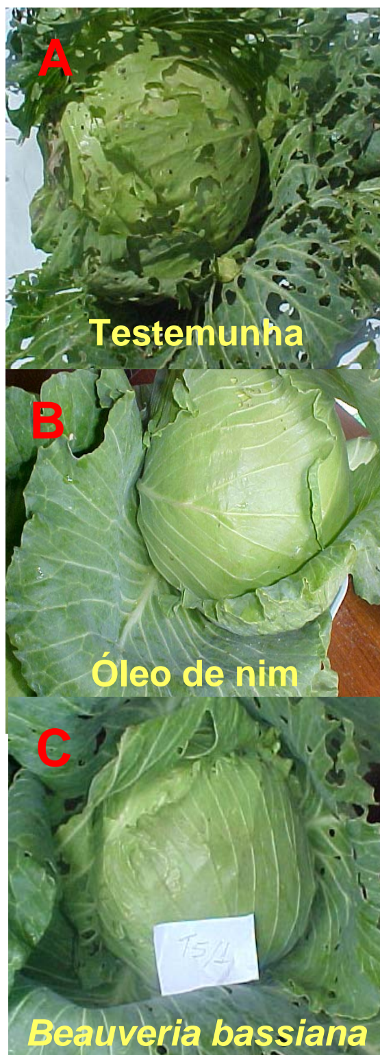
Figura 2 - Severidade de injúrias ocasionadas por lagartas de Spodoptera frugiperda em cabeças de repolho oriundas da testemunha (A) e das parcelas tratadas com formulação comercial de óleo de amêndoas de nim (B) e com o fungo Beauveria bassiana (C).